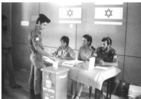
חייל מצביע ביחידתו - כנסת שמינית

מסך כל בעלי זכות ההצבעה (בערך 400 קולות מתוך 3000 אפשריים). גוש מצביעים כזה מסוגל בלי ספק להטות את תוצאות הבחירות, ולכן, במקרה של התאגדות הגוש הזה, יש בכוחו לקדם את האינטרסים שלו ללא קושי. פה עולה